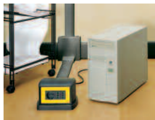
Tavola generale di riferimento Informazioni tecniche specifiche