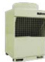
MDS-BR5 24,5÷134 26,0÷148