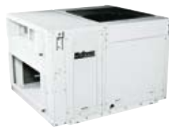
M4RT-AR 17,3÷110 20,2÷126