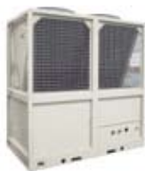
McSmart-C 48,0÷155 -