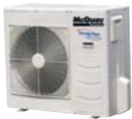
M5MSY-BR 5,40÷7,65 6,40÷8,40